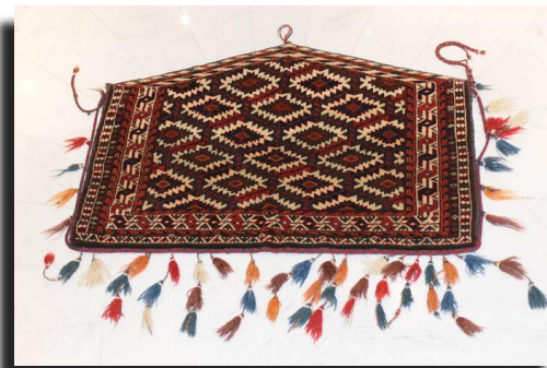
Asmalyks, kussenslopen, zadeltassen